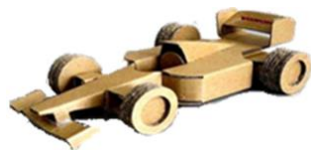
「ミニフォーミュラカー」